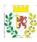
COMUNE DI VANZAGO