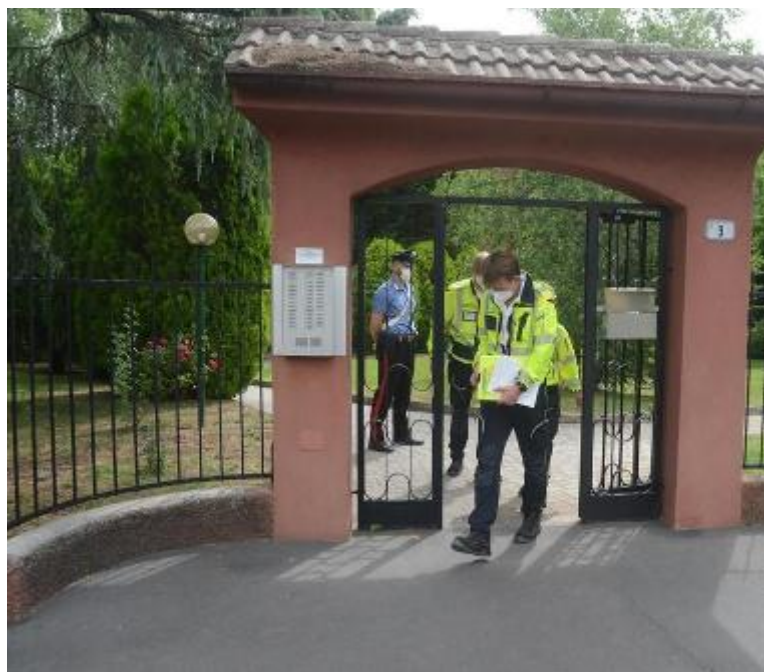
L'ingresso dell'elegante condominio di Arese dove è avvenuto il femminicidio

la sera del 19 giugno ( quella dell'omicidio ) ho visto mia moglie preoccupata, allora l'ho abbracciata, è stato un abbraccio liberatorio, perché so che aveva dei pensieri, per via della vita di nostro figlio. Proprio mentre l'abbracciavo - si legge nelle carte riportate dal pm - ho sentito che lei perdeva i sensi e cadeva battendo la testa sul termosifone. Ha perso sangue per la botta e anche perché a quel punto ha avuto un collasso del sistema cardiocircolatorio e gli alveoli dei polmoni le si sono riempiti di sangue. Poi l'ipnosi che non ha saputo gestire e infine la morte». La richiesta della pena massima è stata formulata davanti alla Corte d'Assise (presidente Ilio Mannucci Pacini) la sentenza arriverà nell'udienza del 15 novembre. Poi il pm Tar-