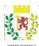
COMUNE DI VANZAGO