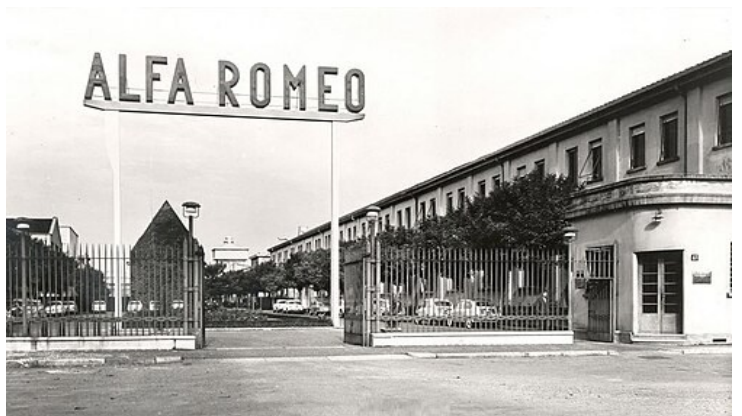
a sinistra veduta aerea di Alfa Romeo Arese; e qui sopra, sempre Alfa Romeo, ma “Portello” Milano.